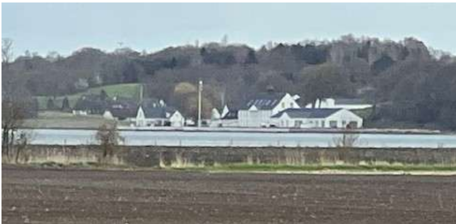
Kig fra Alrø til det tidligere kvindefængsel i Amstrup

Det tidligere kvindefængsel blev indrettet i Amstrup Pakhus, som ligger neden for de høje skrænter på halvøen Jensnæs ind mod Horsens Fjord.