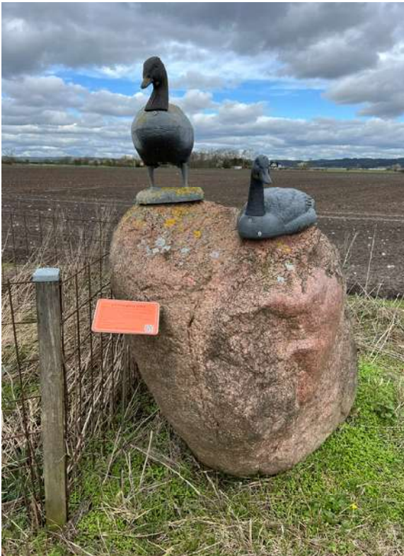
Sten over: "Øens vogtere 2013" Sten øverst t.h.: "Forankret 2013" Sten nederst t.h.: "Fugl og fisk 2013"